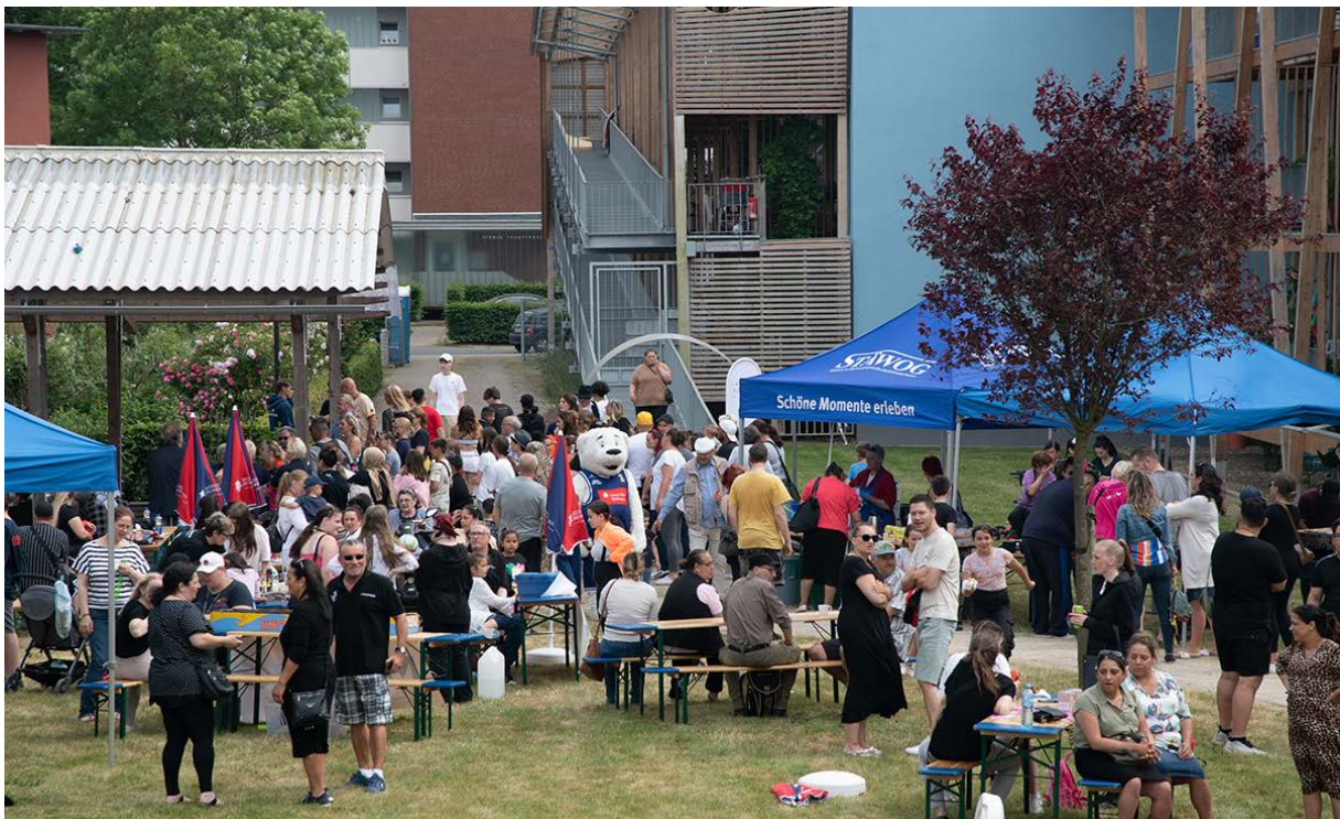
Viel los beim Fest im Garten des Spiralenhauses.

Gemäß Gesellschaftsvertrag sind der Jahresabschluss und der Lagebericht nach den Vorschriften für große Kapitalgesellschaften aufzustellen und zu prüfen.